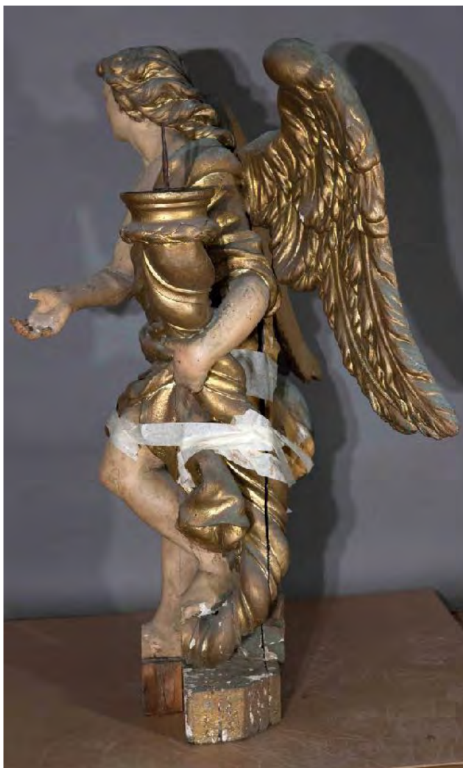
Skulpture prije radova