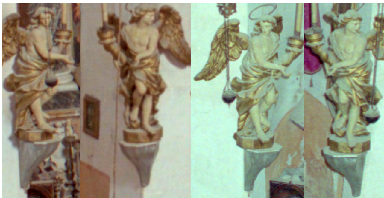
Izvorni smještaj anđela lučonoša in situ izdvojen iz fotodokumentacije stanja crkve u svibnju 1992. iz arhiva Konzervatorskog odjela.