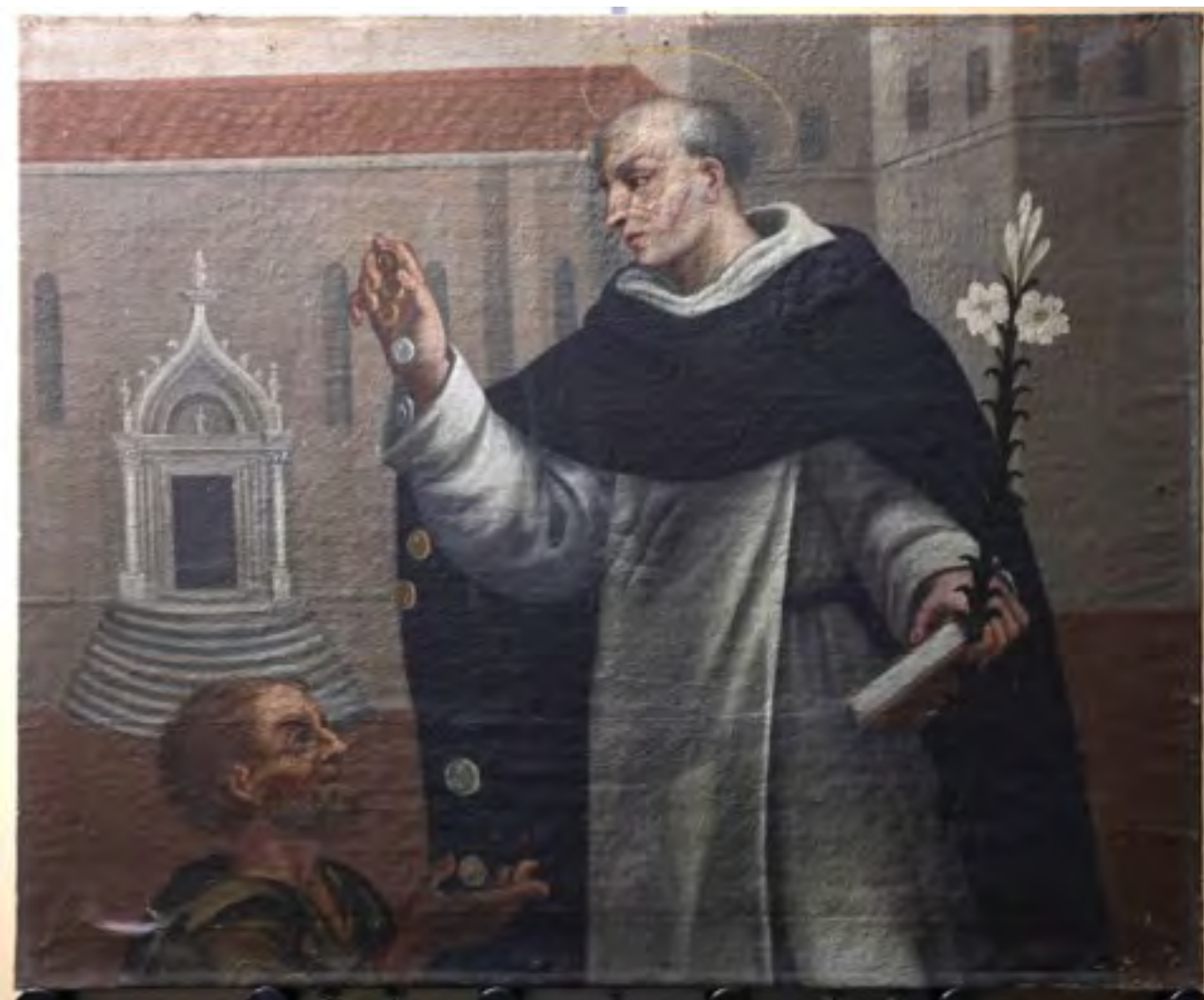
Koso osvjetljenje pokazuje deformacije, zakite i ljuške slike