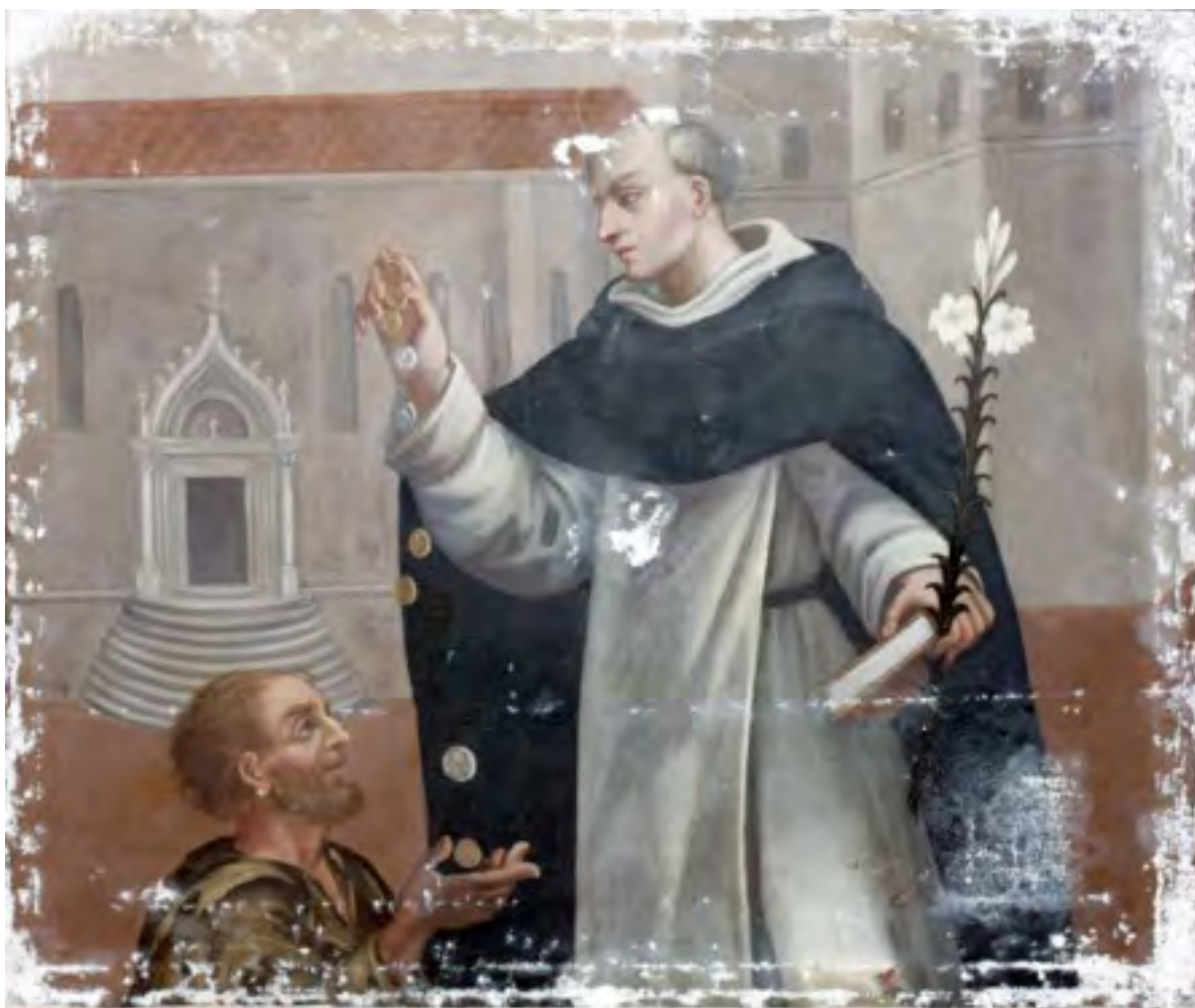
Slika u tijeku obrade i teksturiranja zakita