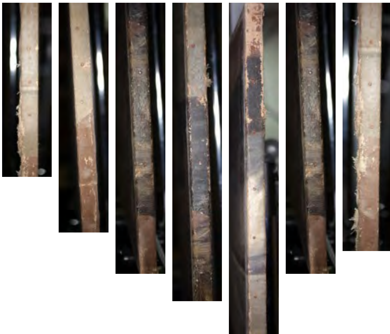
Oslikani rubovi slike

Premaz slikarske osnove na poleđini slike dopire samo do ruba drvenog podokvira što znači da je naknadno nanesen nakon napinjanja slike na smanjeni podokvir