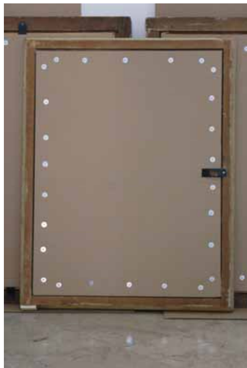
Francesco Zugno, Sv. Ivan Krstitelj , 18. st., 95 x 72 cm