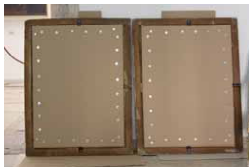
Ioann Cingeri, Arkadijski krajolici , 1748. god., 76 x 100 cm (4 slike istih dimenzija)