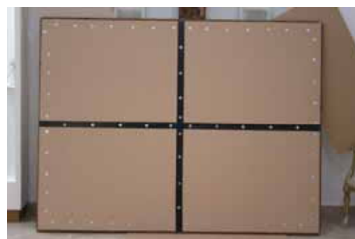
Michail Sca, Poklonstvo triju kraljeva , 1749. god. 160 x 213 cm