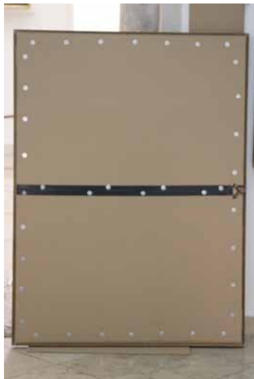
Michail Sca, Sv Ana , 18. st. 106 x 142 cm