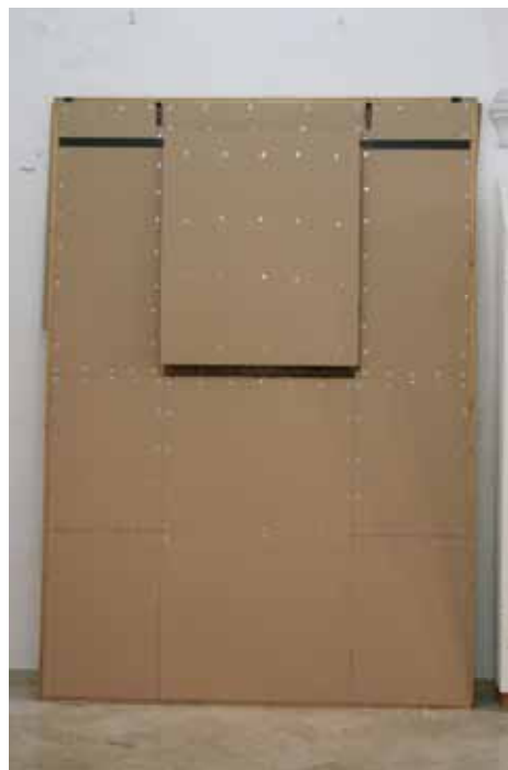
Donato Bizamano, Bogorodica s djetetom , 16 st. Slika 125 x 96 cm ugrađena u sliku nep. slikara, Sv. Dominik, sv. Antun pustinjak, sv. Jelena križarica, sv. Janja mučenica , 16 st., 310 x 217 cm