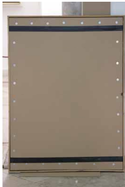
Michail Sca, Krist na Maslinskoj gori , 1749. god. 105 x 143 cm