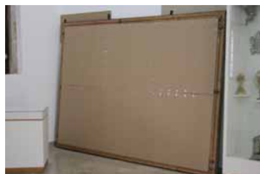
Nep. majstor (Antonio De Bellis?), Bogorodica sa sv. Vlahom i sv. Franjom , 17. st., 302 x 200 cm