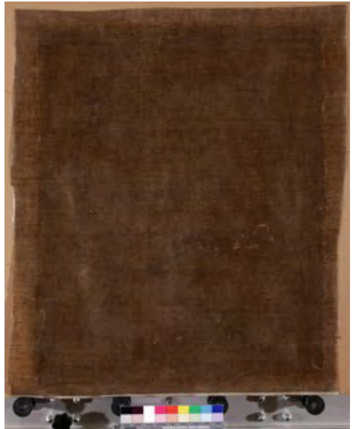
Lijevo: Slika nakon čišćenja, uklanjanja preslika i diskoloriranih lakova. Desno: Poleđina slike nakon novog dubliranja.