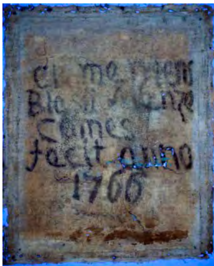
Lijevo: Poledina slike nakon uklanjanja dublirnog platna. Desno: Natpis se znatno bolje vidi u UV fluorescenciji. Dio natpisa se transferirao na dublirno platno.