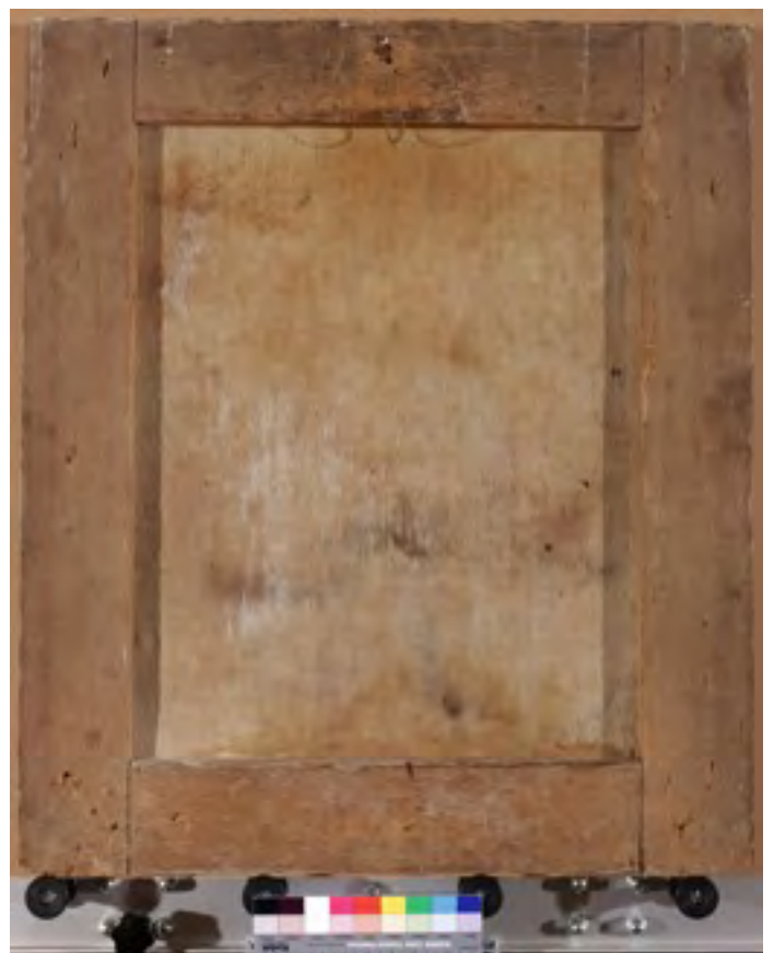
Lijevo: Slika nakon retuša. Desno: Poleđina nakon svih radova (vraćeno je staro (autentično) dublirno platno).