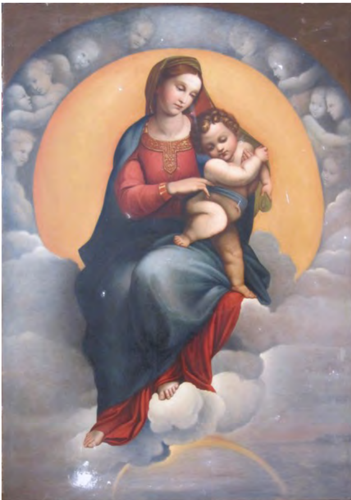
Slika nakon uklanjanja sloja nečistoće i diskoloriranih lakova i retuša te nakon ravnanja, konsolidiranja i kitanja nedostajućih dijelova slike.