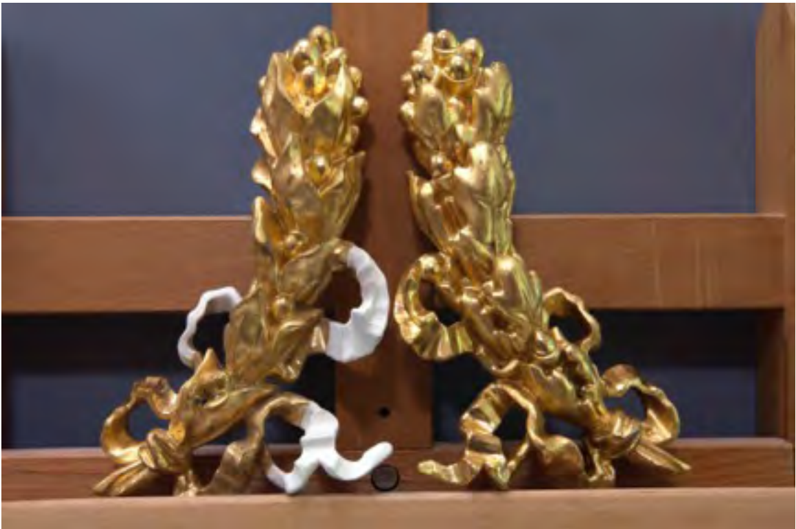
Grb i ukrasi na okviru u tijeku izrade nedostajućih dijelova. Nedostajuće forme su izrezbarene u lipovini i kredirane za pozlatu pravim zlatom