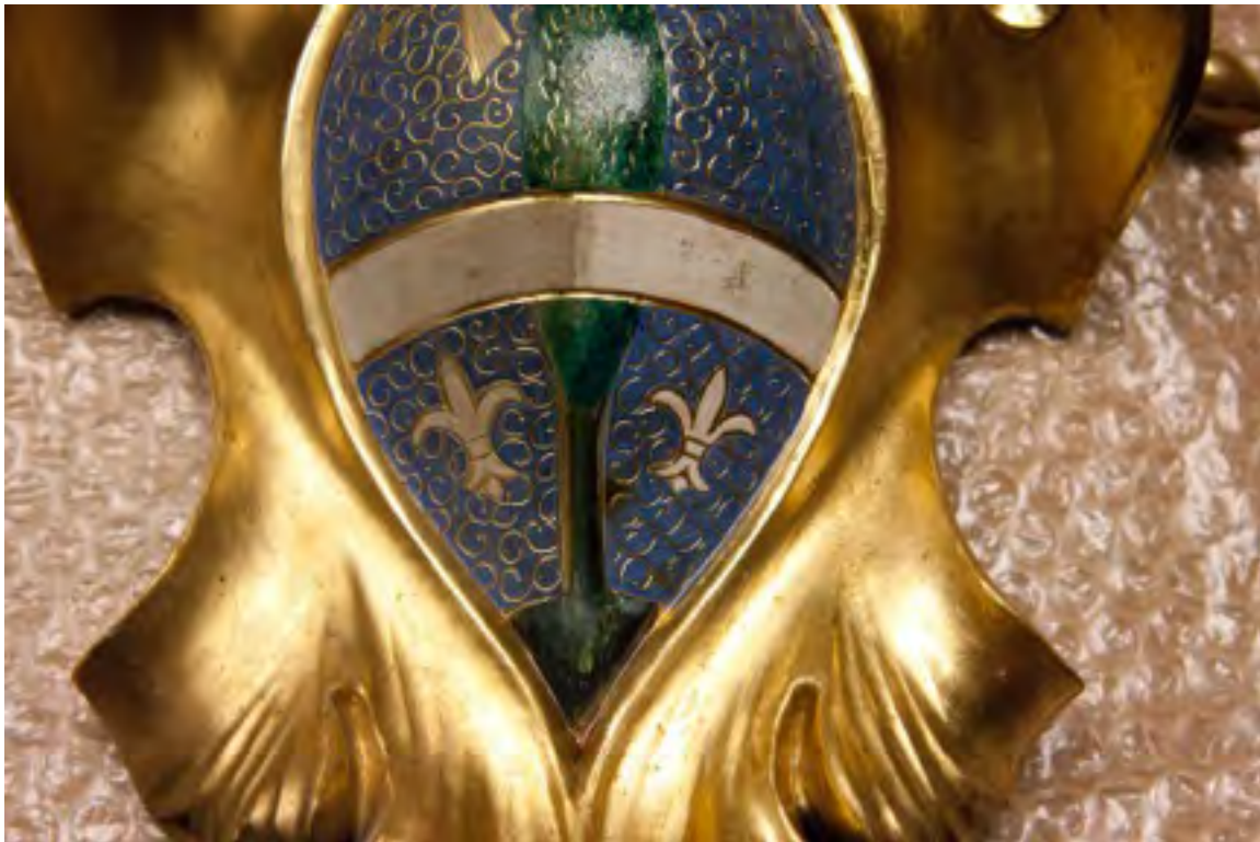
Grb u tijeku uklanjanja površinske nečistoće (zlato i desna polovica oslika su očišćene)